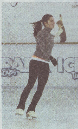
Da Sochi Valentina Marchei

■ Inaugurazione ufficiale per il Village Market Opificium questa sera in viale di Tor di Quinto. L'appuntamento cadrà ogni week end sino al 18 maggio, presso il villaggio invernale di Ice Park è ed è stato pensato come un luogo dove andare alla scoperta di prodotti delle categorie più varie: abiti, accessori e creazioni di giovani stilisti e designer emergenti ma anche di artigiani e artisti. Village Market Opificium nasce dall'unione di expertise diverse che hanno come denominatore comune la qualità e l'amore per l'originale, in tutte le sue forme d'arte.